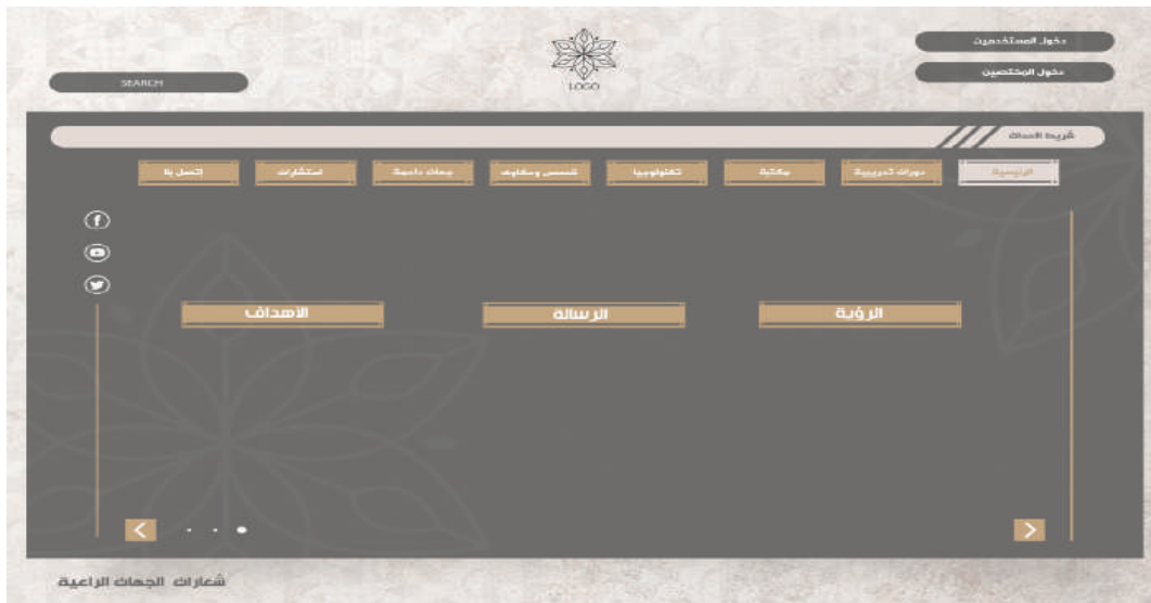
شكل (٣): نموذج مقترح لمنصة تفاعلية موجهة لمقدمي الرعاية الأسرية لكبار السن

وعليه، فإننا من خلال ما سبق من النتائج نقبل الفرضية البحثية التي تنص على أنه: توجد فروق ذات دلالة إحصائية عند مستوى (٠,٠٥) بين متوسطات مستوى الصعوبات التي تواجه مقدمي الرعاية الأسرية لكبار السن تبعًا لمتغير تلقي المساعدة.